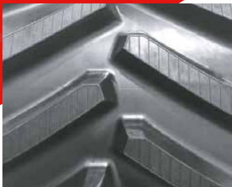
30" JOHN DEERE 9000T