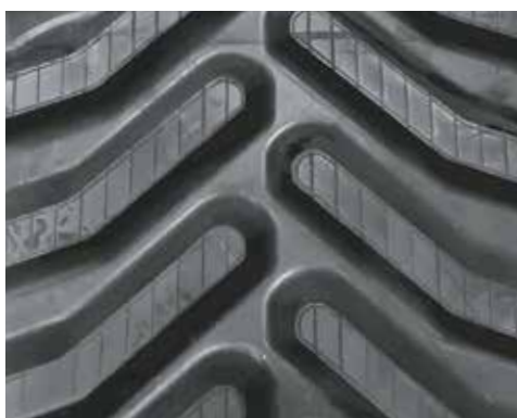
24" CHALLENGER MT700