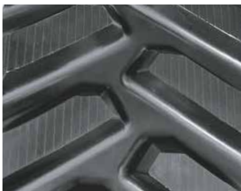
18" CASE ROWCROP