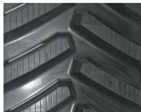
30" CHALLENGER MT800