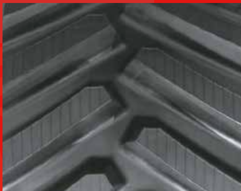
30" JOHN DEERE 8RT