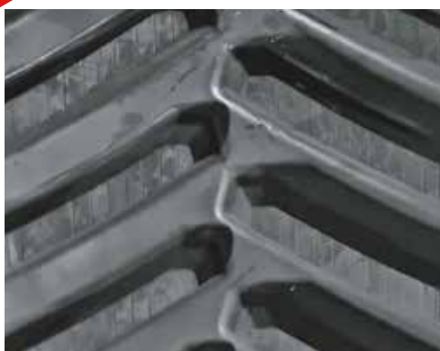
24" CHALLENGER 35/34/55