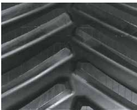
30" CASE QUADTRAC