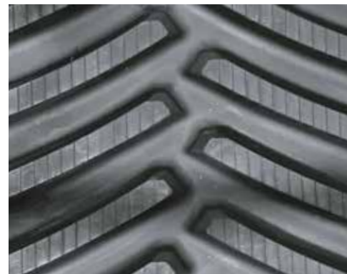
36" JOHN DEERE 9RX